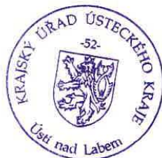
RNDr. Tomáš Burian v zastoupení vedoucí odboru životního prostředí a zemědělství

Toto stanovisko SEA není závazným stanoviskem ani rozhodnutím podle zákona č. 500/2004 Sb., správní řád, ve znění pozdějších předpisů a nelze se proti němu odvolat.